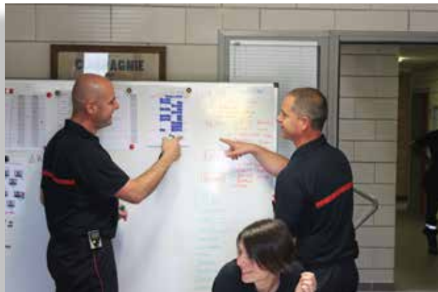
• Première formation organisée début juin

La formation de concepteur de formation consiste à l'ingénierie de pédagogie et la formation des formateurs accompagnateurs.