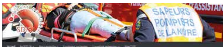
• Accueil du site internet

La mise en ligne d'un site intranet permettra un meilleur accès aux informations, aux documents utiles... avec la possibilité, dans une prochaine version, d'effectuer un travail collaboratif. Cet intranet est d'abord déployé sur le réseau, c'est-à-dire accessible seulement depuis les ordinateurs ayant un accès au réseau du SDIS. Il sera ensuite accessible, dans quelques mois, de l'extérieur et donc depuis n'importe quel ordinateur, smartphone... ayant accès à internet. Cet intranet a été développé de manière agile, c'est à dire que l'on peut modifier à tout moment son architecture et ses informations. La version actuellement proposée est la version n°1 : la version n°2 est déjà en cours de réflexion.