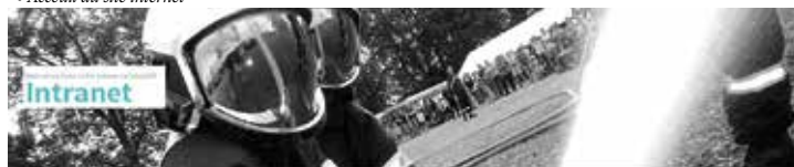
• Accueil du site intranet